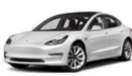
Tesla Model 3