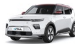
Kia e Soul