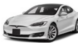
Tesla Model S